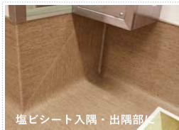
塩ビシート入隅・出隅部に