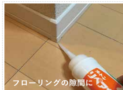
フローリングの隙間に