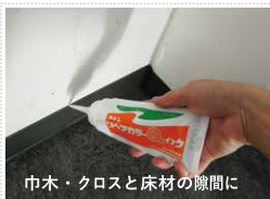
巾木・クロスと床材の隙間に